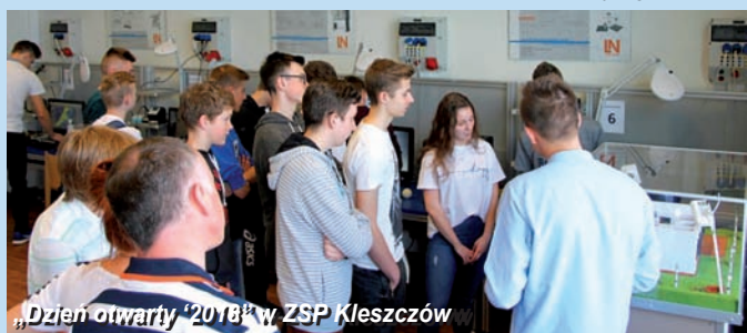
„Dzień otwarty” 2018 w ZSP Kleszczów