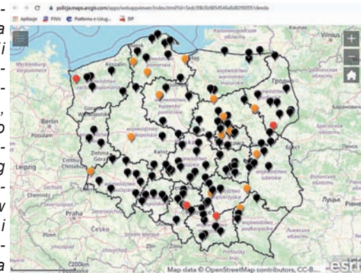
Tak wyglądała mapa 19 lipca

„Bieżąca aktualizacja, w tym wizualizacja danych, ma na celu zwrócenie uwagi na skalę tragedii do jakich dochodzi na polskich drogach, skłonienie do refleksji użytkowników dróg oraz zachęcenie mediów do dyskusji na temat bezpieczeństwa w ruchu drogowym” - czytamy