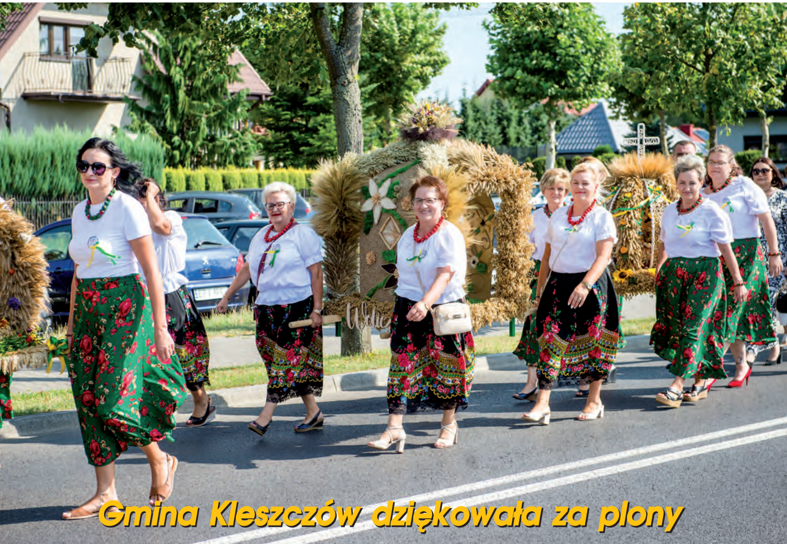
Gmina Kleszczów dziękowała za plony

Autoryzowany serwisant firm: TERMET, FERROLI, ARISTON, SAS, DE DIETRICH