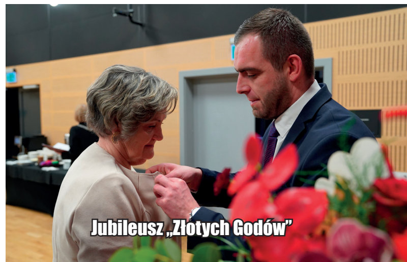
Jubileusz „Złotych Godów”