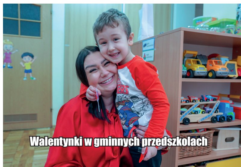
Walentynki w gminnych przedszkolach