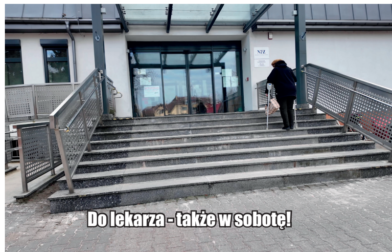
Do lekarza - także w sobotę!