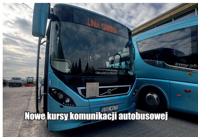
Nowe kursy komunikacji autobusowej